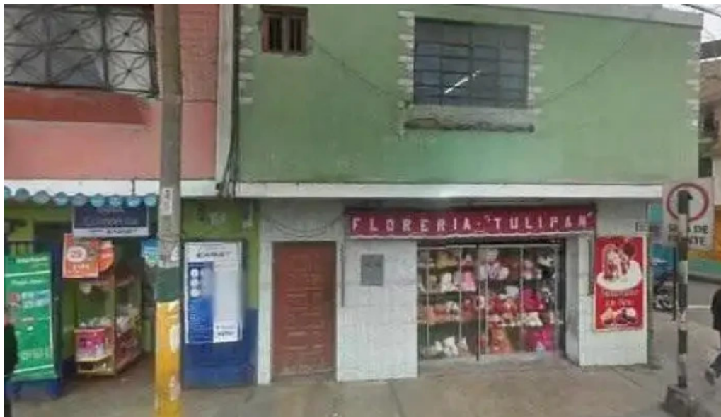
Inkafarma barranca 7 comentarios