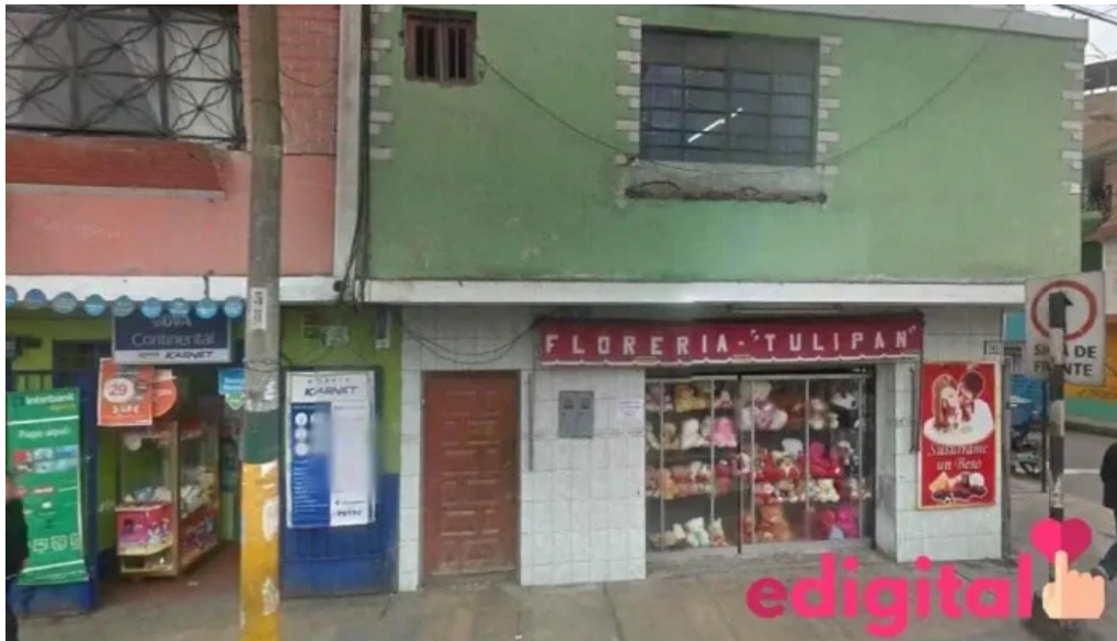
Inkafarma barranca 7 barranca