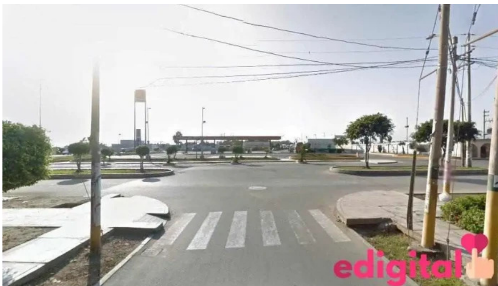
Botica las palmeras barranca