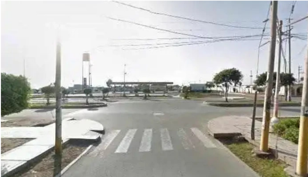
Botica las palmeras precios