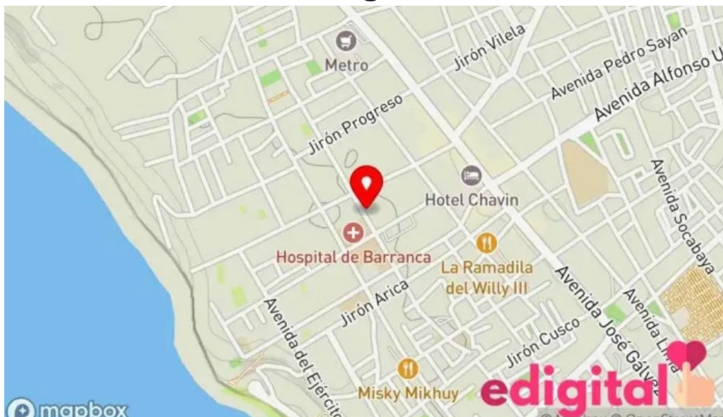
Botica cc salud mapa