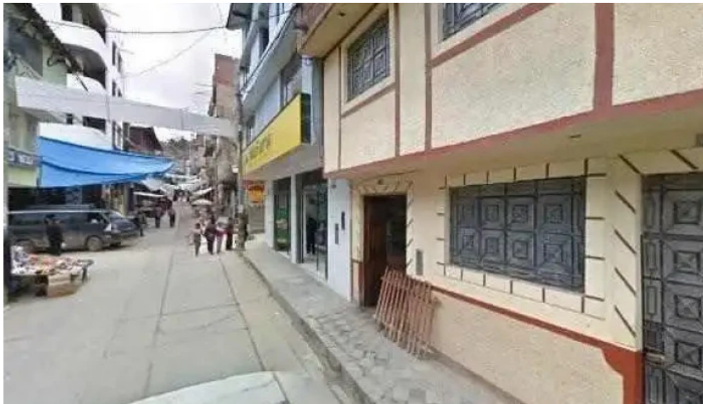
Inkafarma cerca de mi