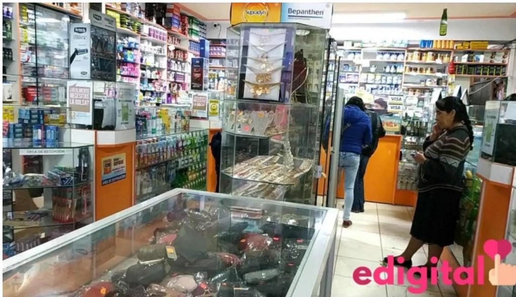
Farmacia bambamarca como llegar