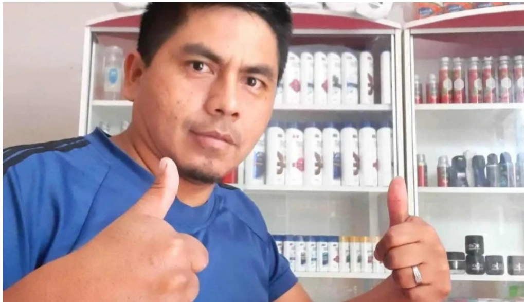
Botica shanyfarma del propietario