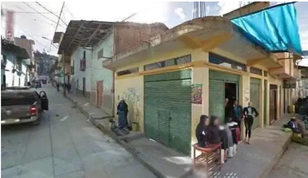
Botica shanyfarma puntajedeg