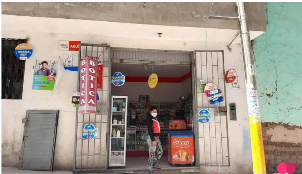
Botica shanyfarma bambamarca