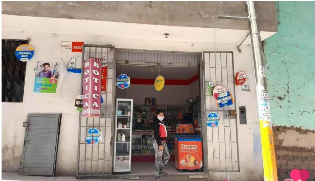
Botica shanyfarma puntaje