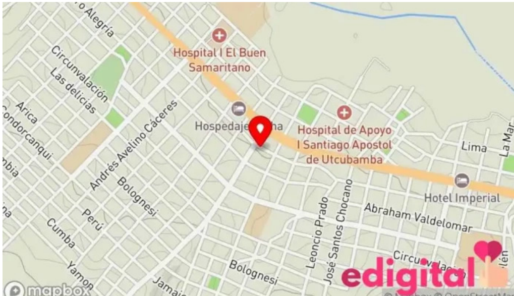
Botica san pedro bagua grande mapa