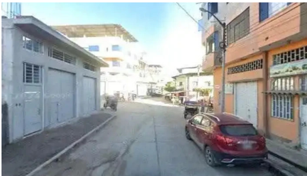
Botica san pedro bagua grande videosdeg