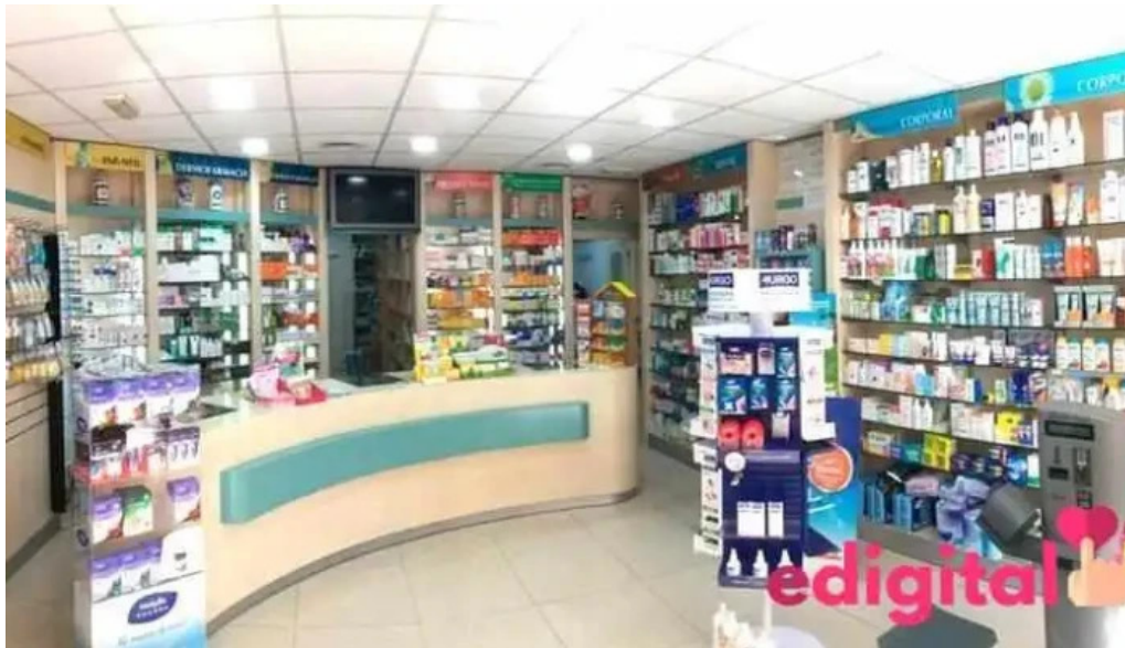
Botica galileo azangaro