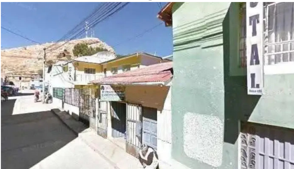
Botica aml farma opinionesdeg