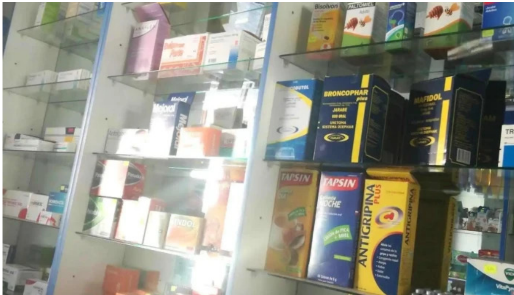
Botica aml farma opiniones