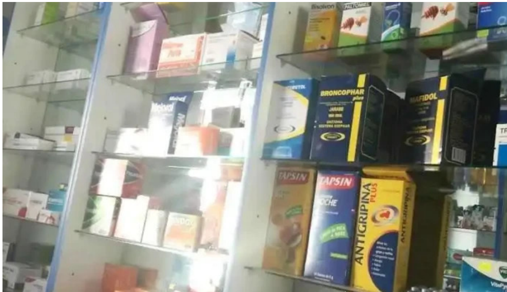
Botica aml farma azangaro