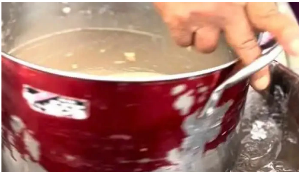
Mi farma ayacucho