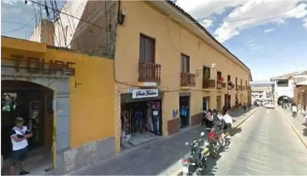
Mi farma como llegardeg