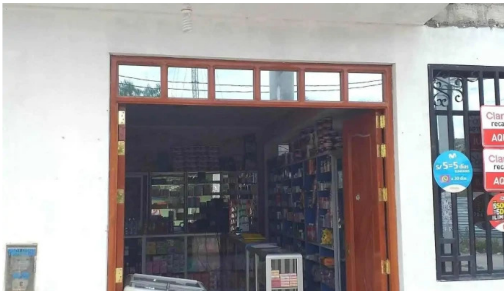
Farmalian del propietario