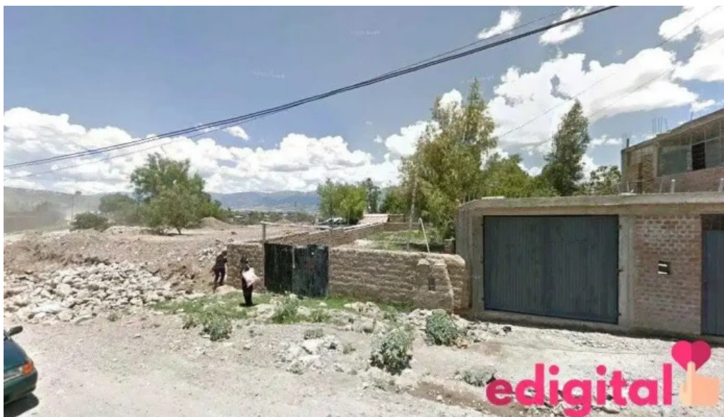
Farmacia tufarma ayacucho