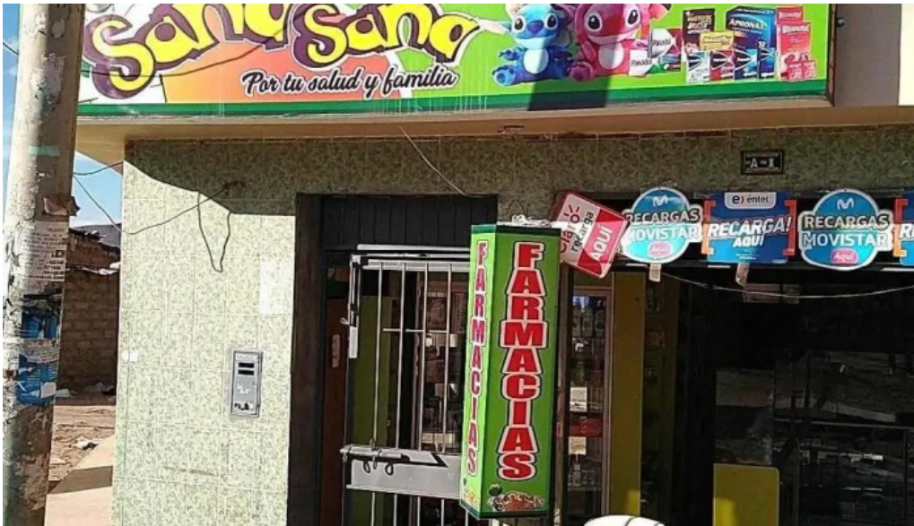
Farmacia sana sana comentarios