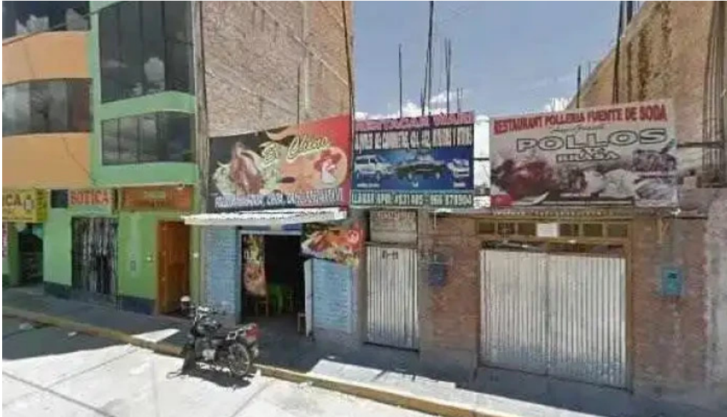
Farmacia sana sana comentariosdeg