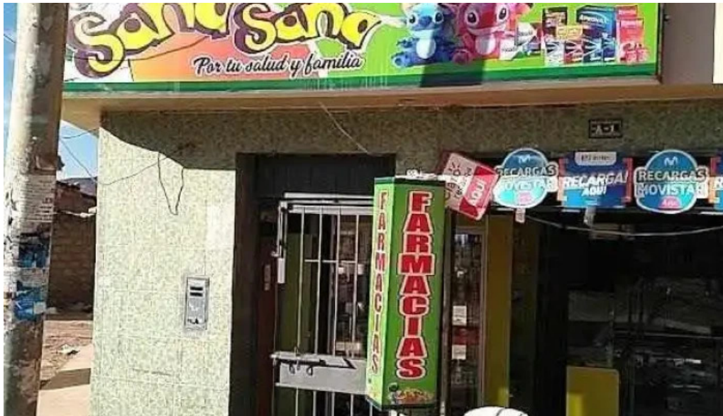
Farmacia sana sana ayacucho