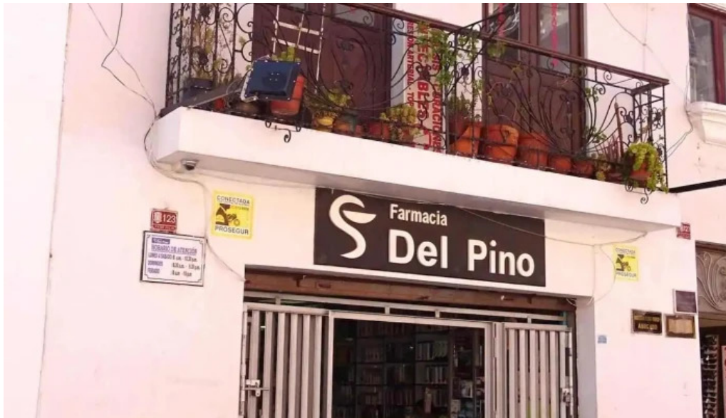
Farmacia del pino zona