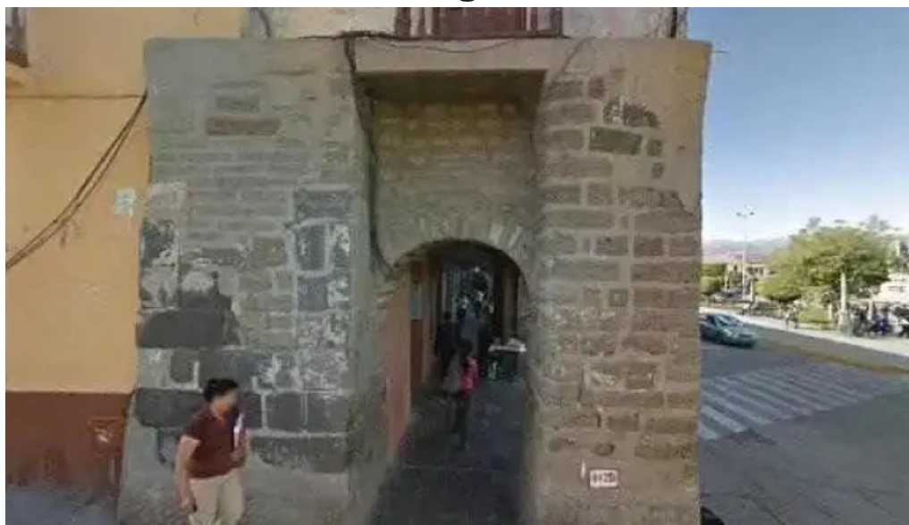
Farmacia del pino zonadeg