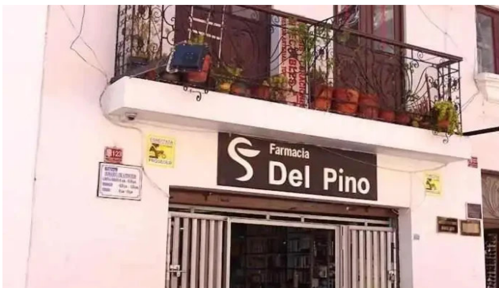
Farmacia del pino ayacucho