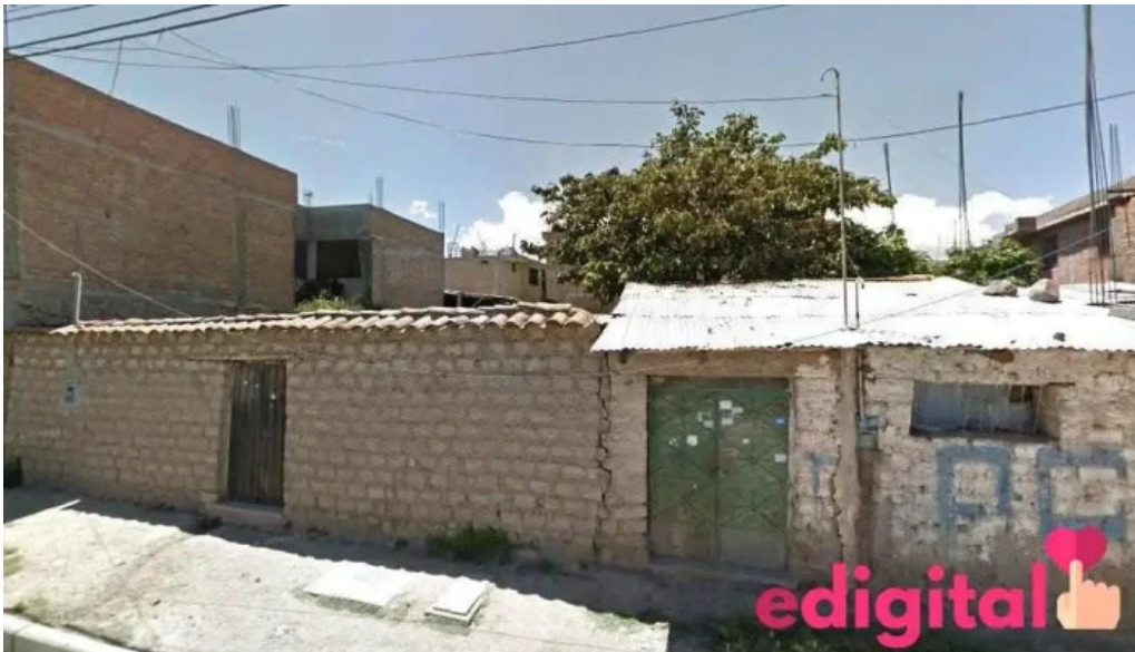
Boticas simar peru ayacucho