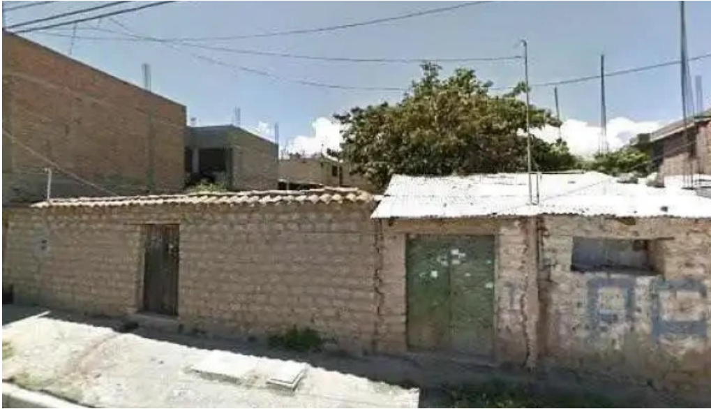
Boticas simar peru donde