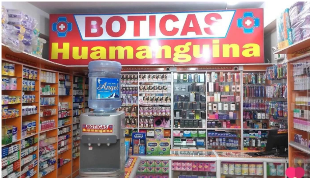
Boticas huamanguina promocion