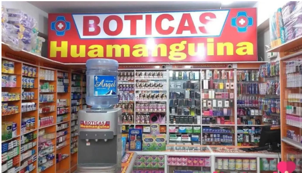
Boticas huamanguina ayacucho