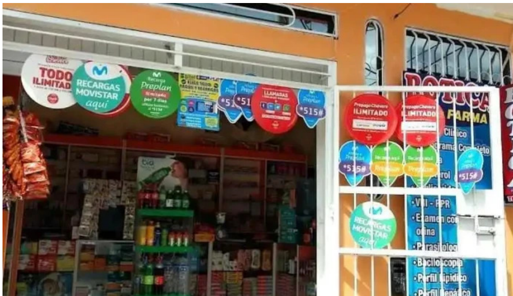
Botica j l farma ayacucho