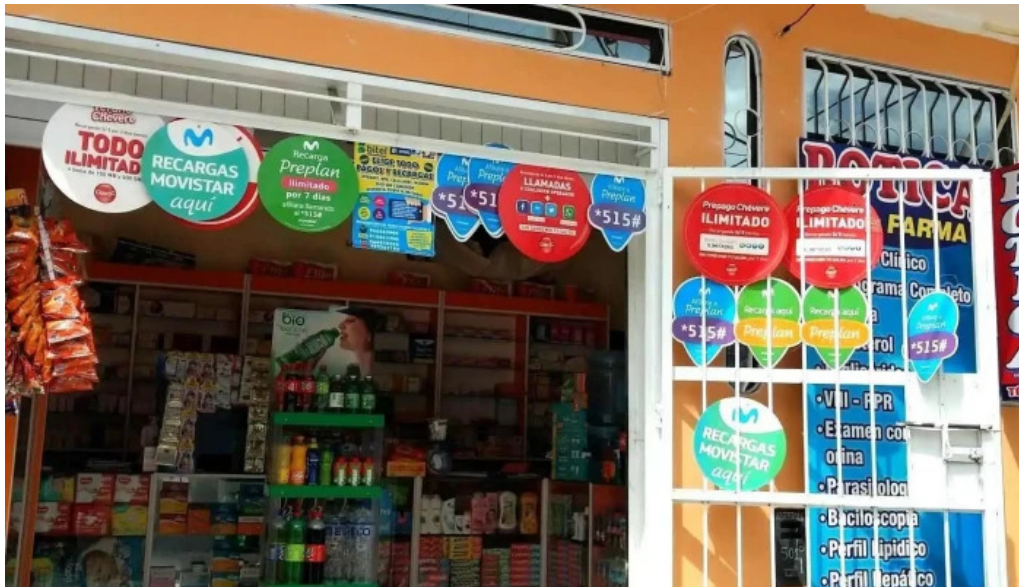
Botica j l farma fotos