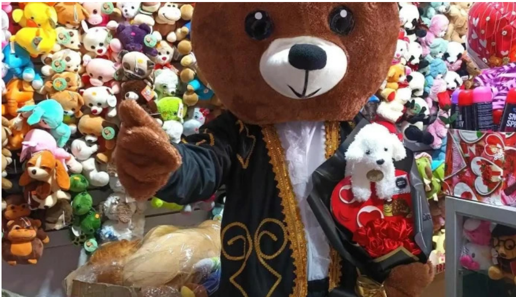
Botica farma hogar cerca de mi