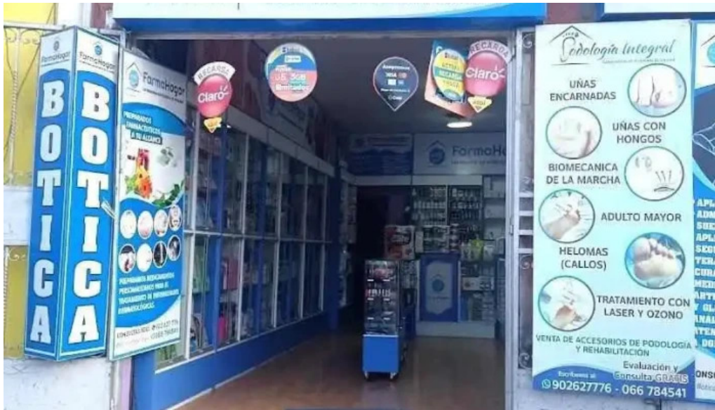
Botica farma hogar ayacucho