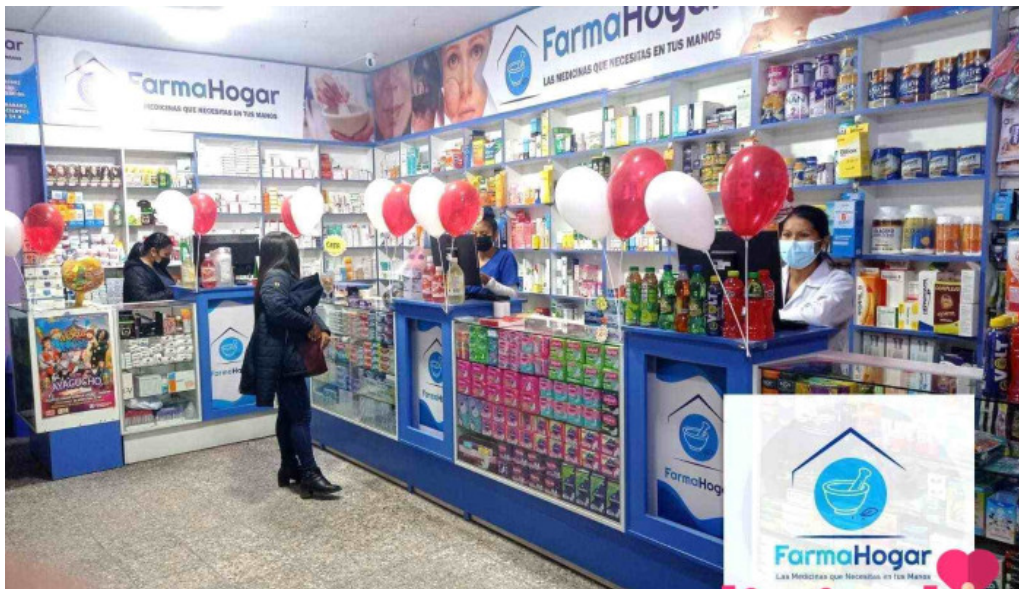
Botica farma hogar del propietario