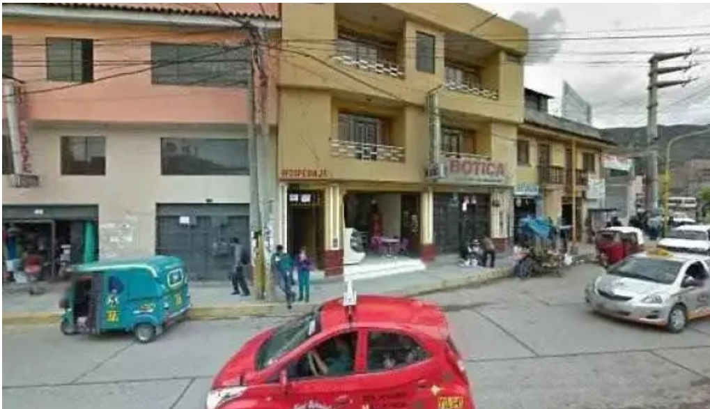
Botica farma hogar cerca de mideg