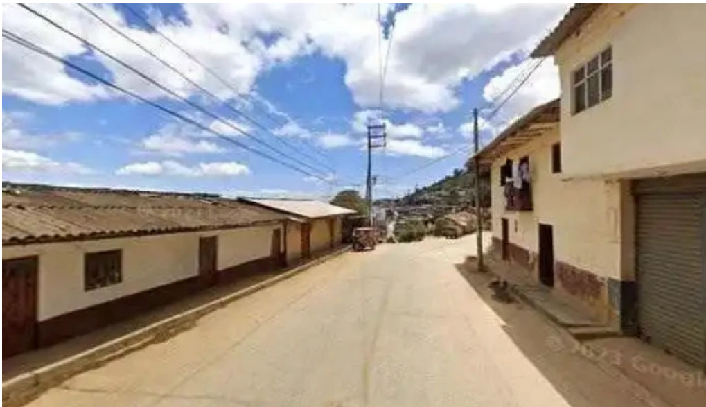
Botica flores de ayabaca y agente banco de la nacion fotosdeg