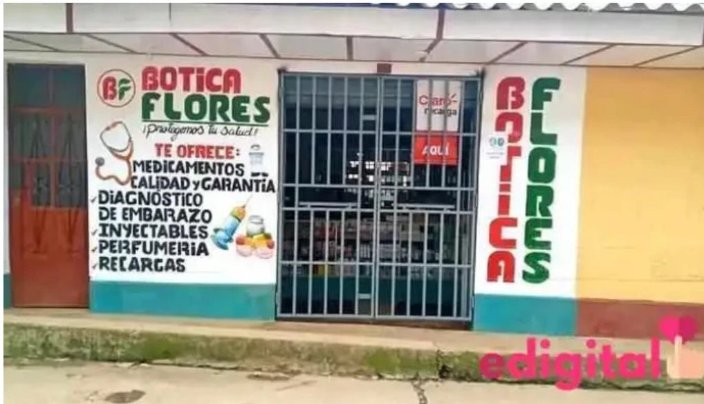
Botica flores de ayabaca y agente banco de la nacion ayabaca