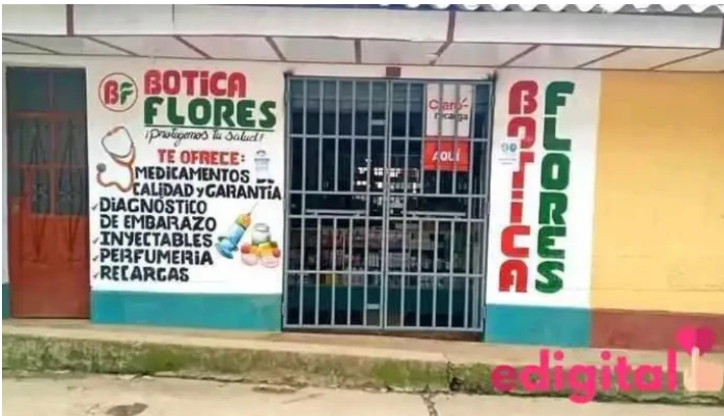
Botica flores de ayabaca y agente banco de la nacion fotos