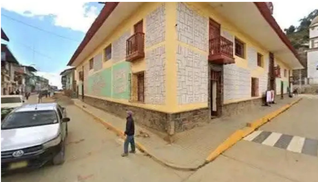
Botica central ubicacion