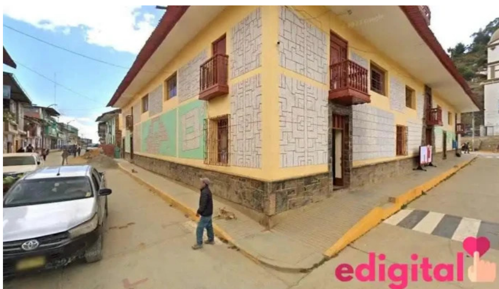
Botica central ayabaca