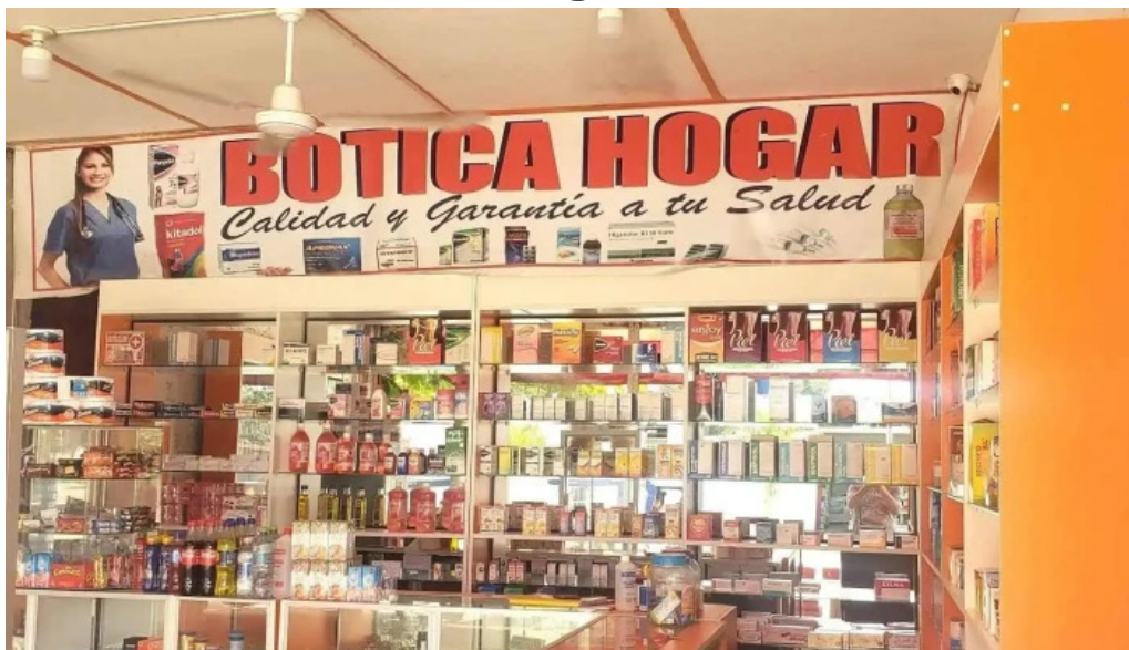
Botica hogar 2 telefono