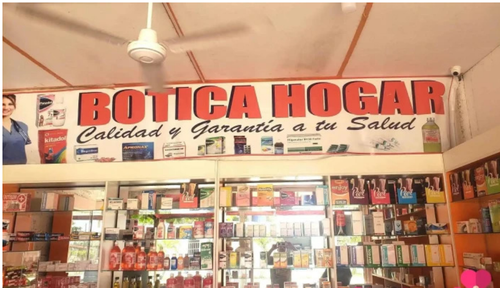
Botica hogar 2 del propietario