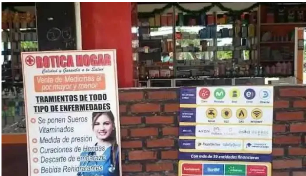
Botica hogar 2 atalaya