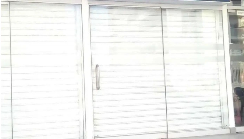
Botica caja arequipa arequipa