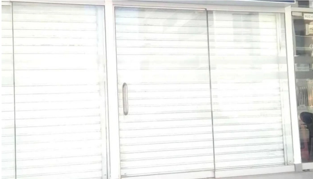
Botica caja arequipa precios