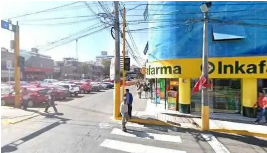
Inkafarma abierto ahora