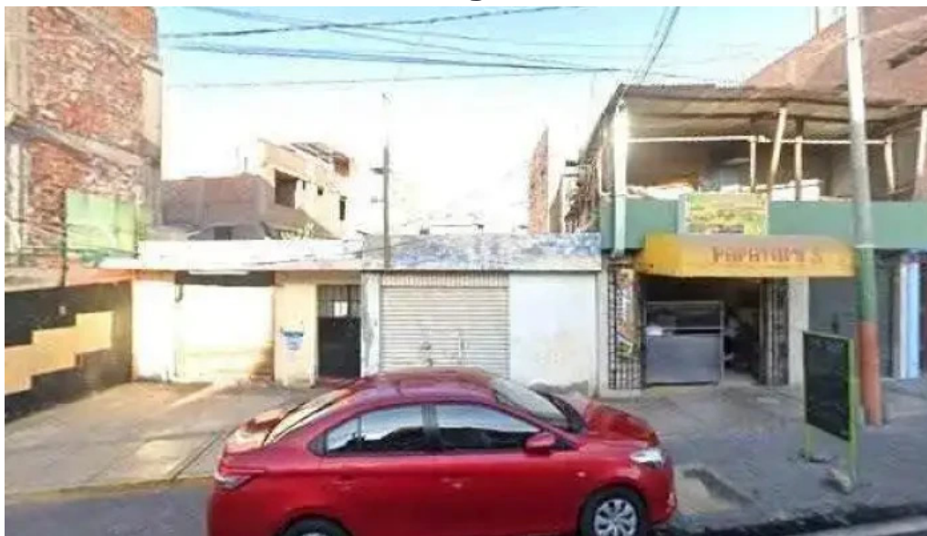
Farmacia villalba sitio web