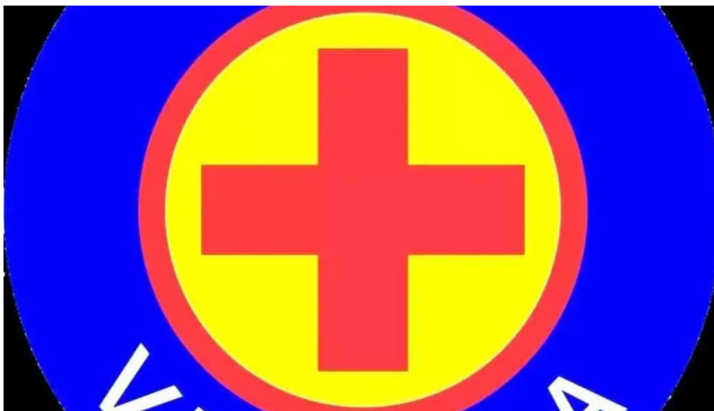
Farmacia villalba arequipa