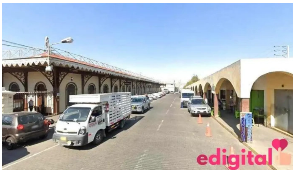
Farmacia villalba arequipa