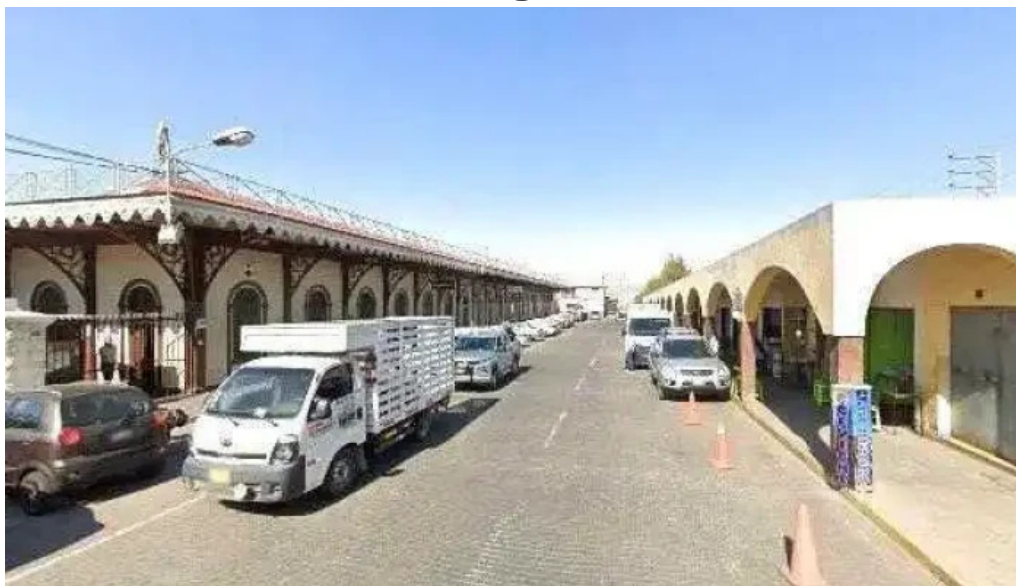
Farmacia villalba telefono