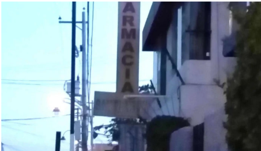
Farmacia santa ursula descuentos