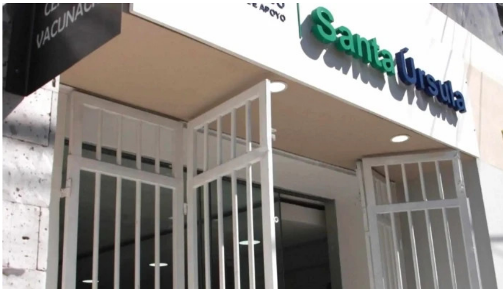
Farmacia santa ursula arequipa