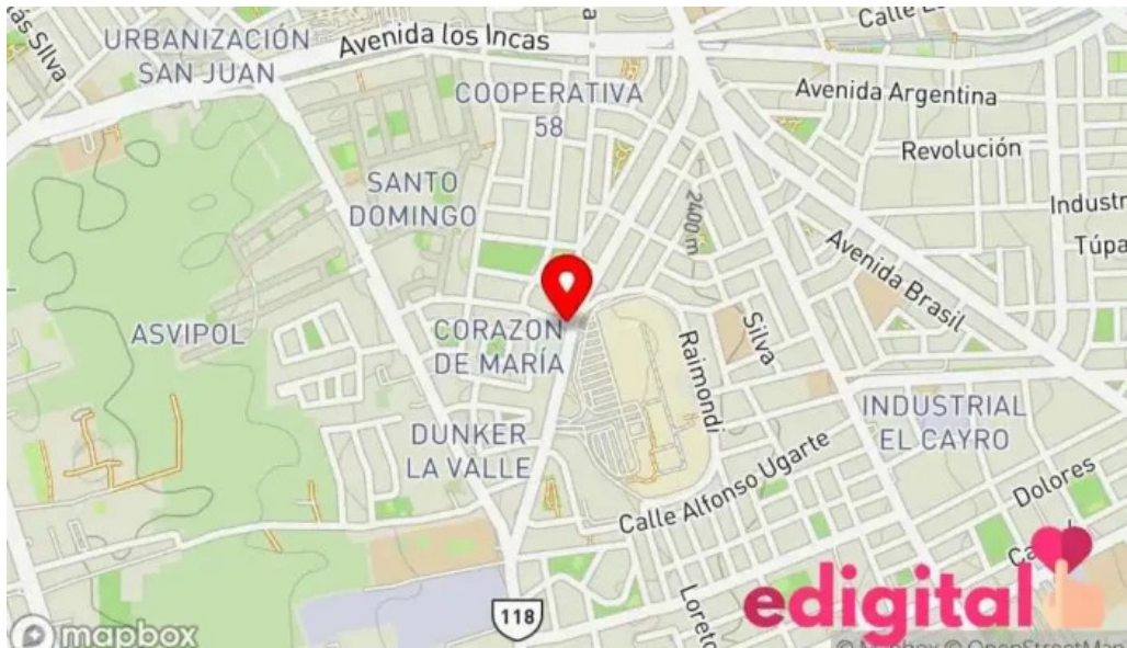
Farmacia prosalud mapa