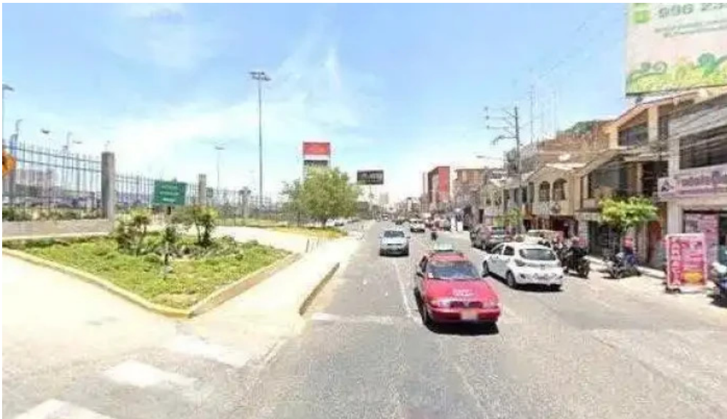
Farmacia prosalud opiniones