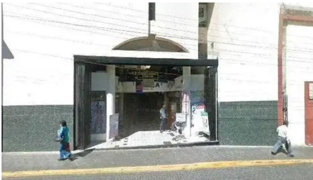
Farmacia gama donde