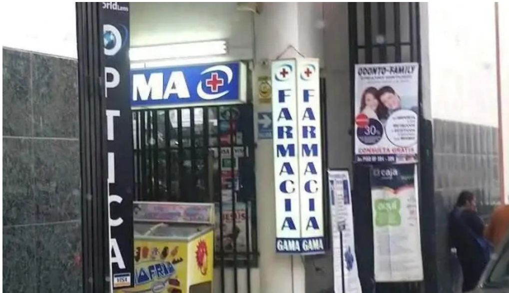
Farmacia gama arequipa