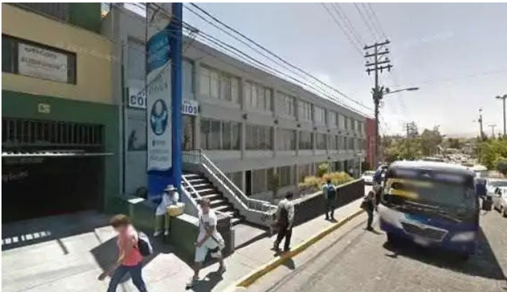
Farmacia clinica arequipa zona