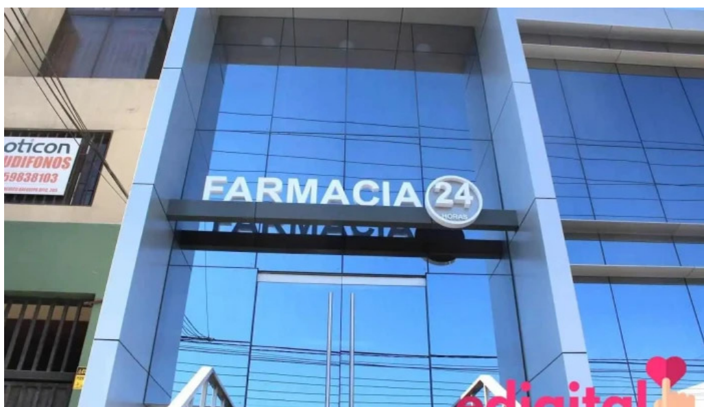
Farmacia clinica arequipa arequipa