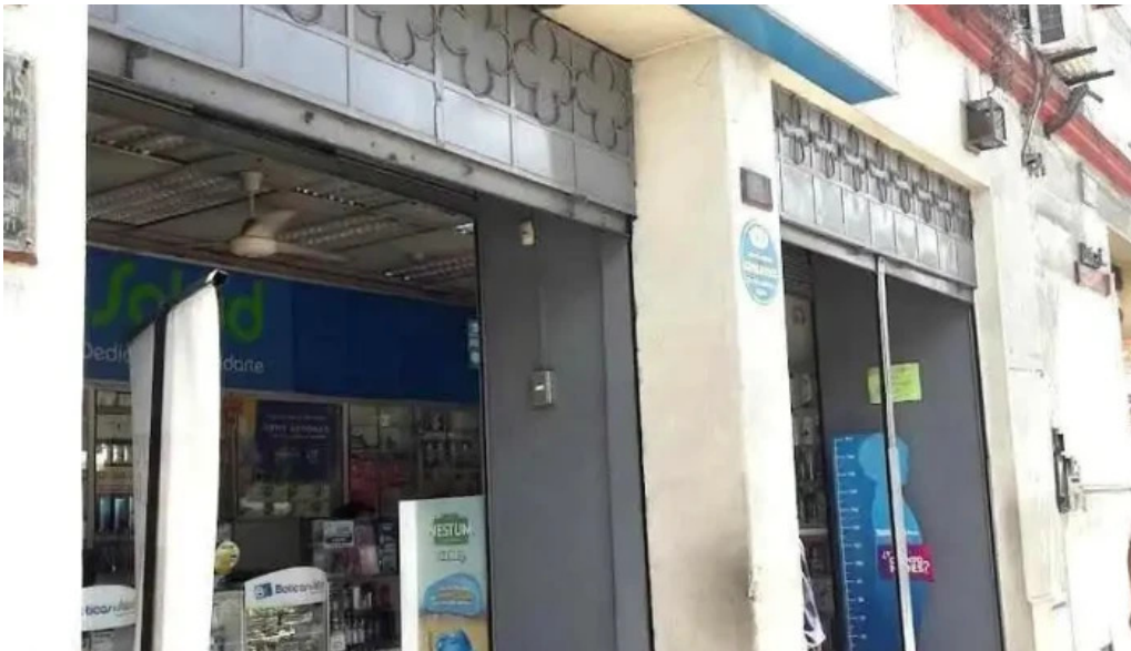
Boticas y salud arequipa