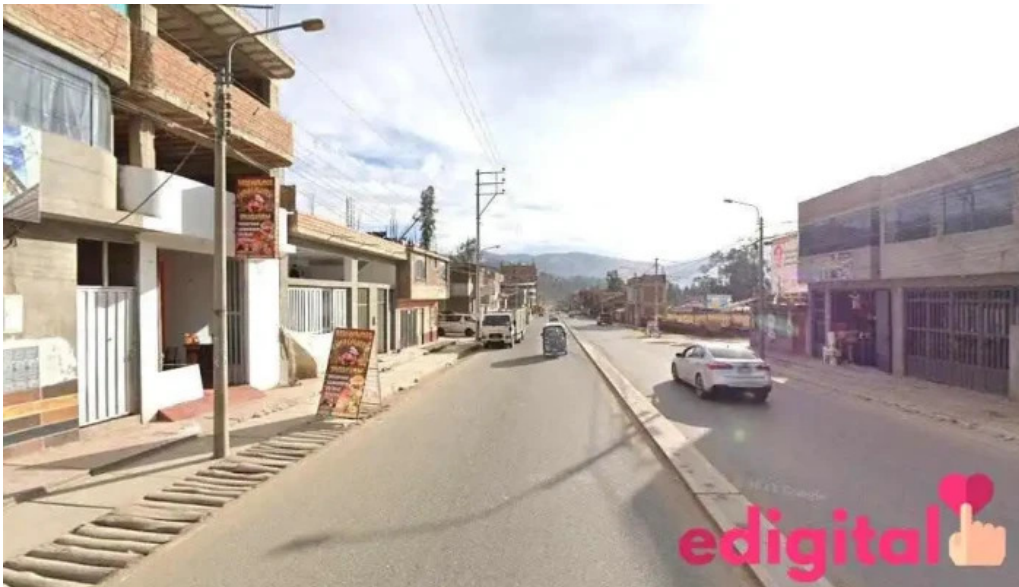
Botica san jose andahuaylas