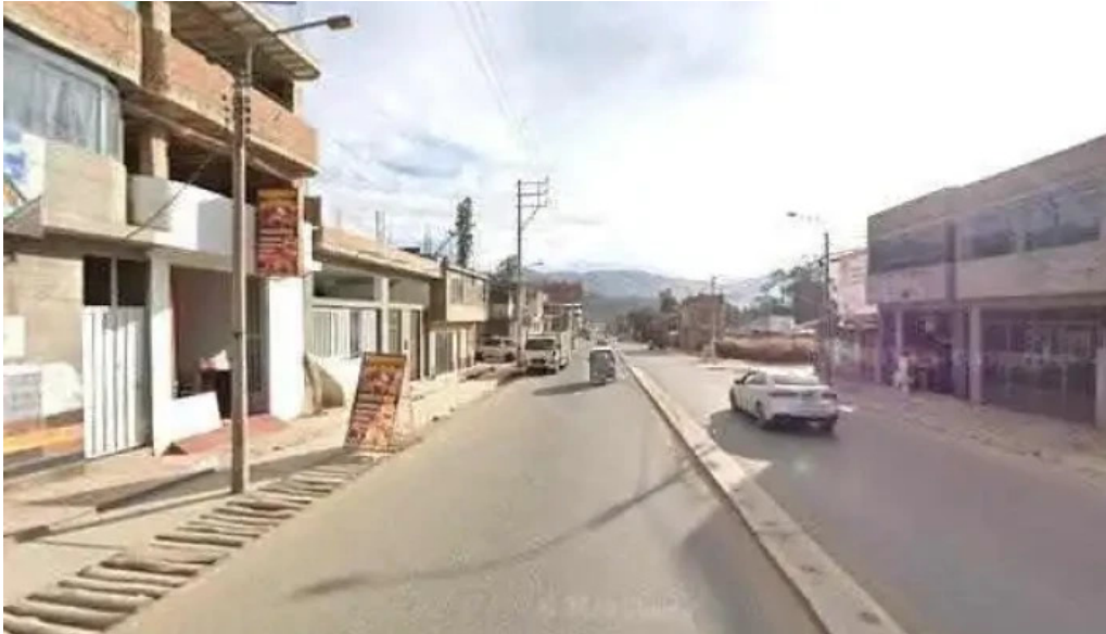
Botica san jose instagram