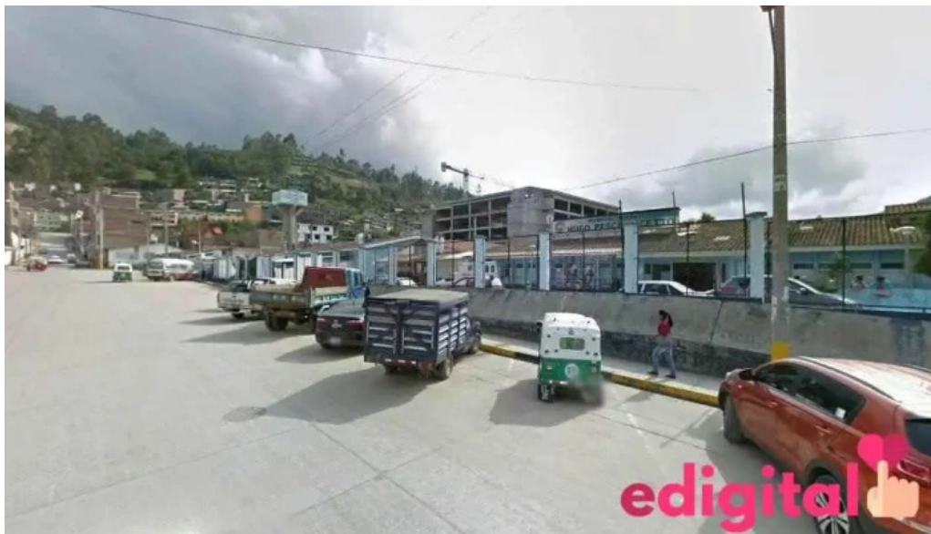
Botica dermopharma andahuaylas