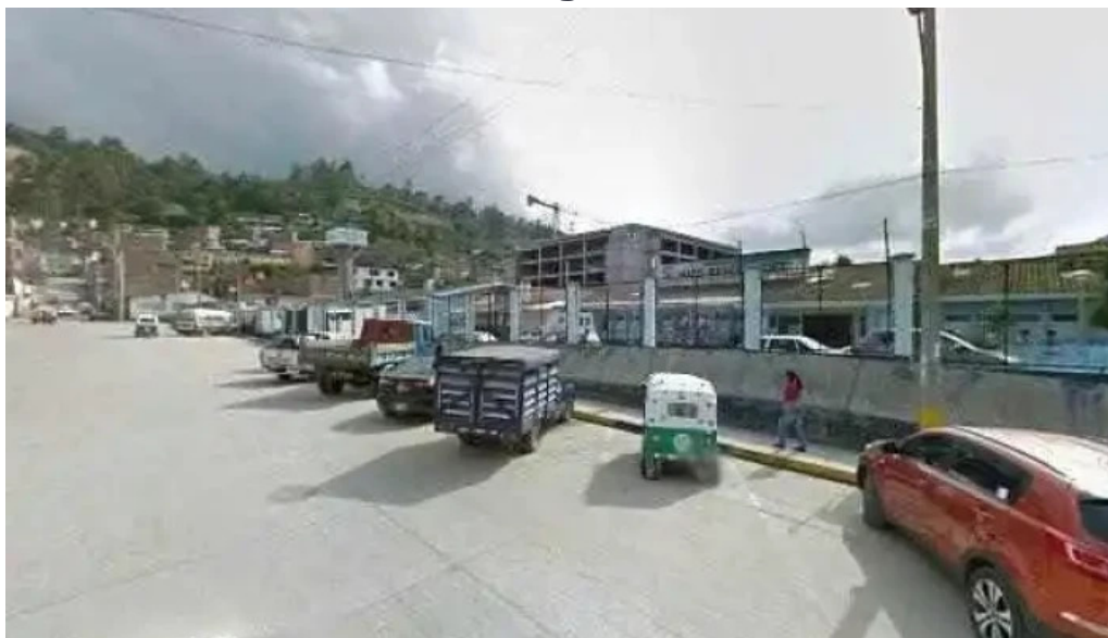
Botica dermopharma ubicacion