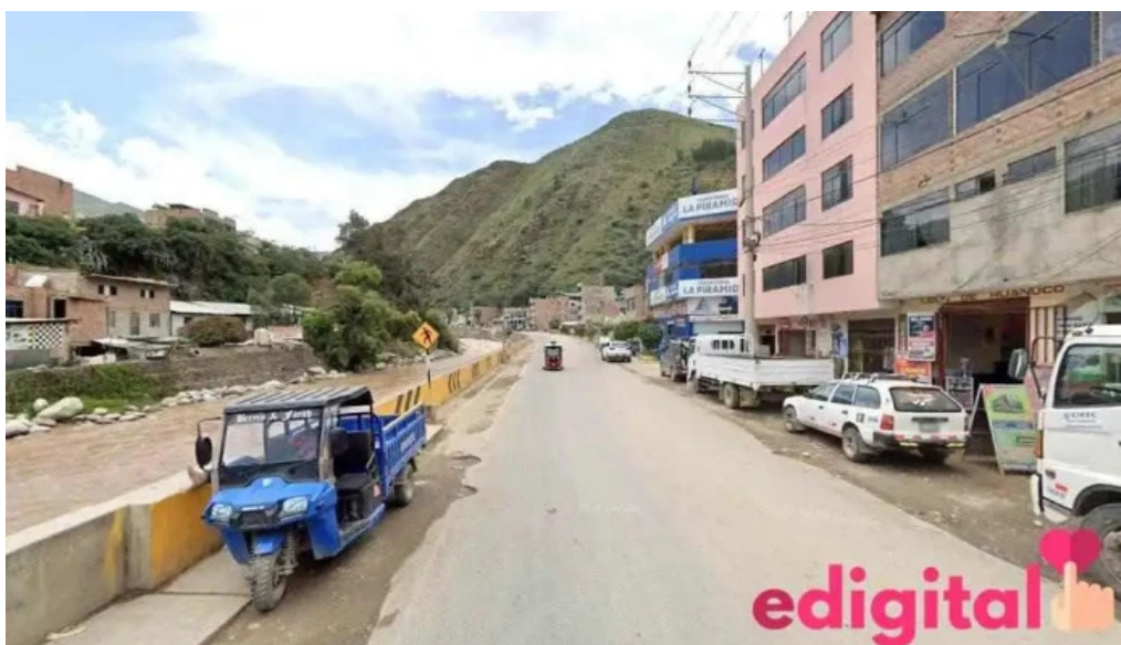
Botica vida sana ambo