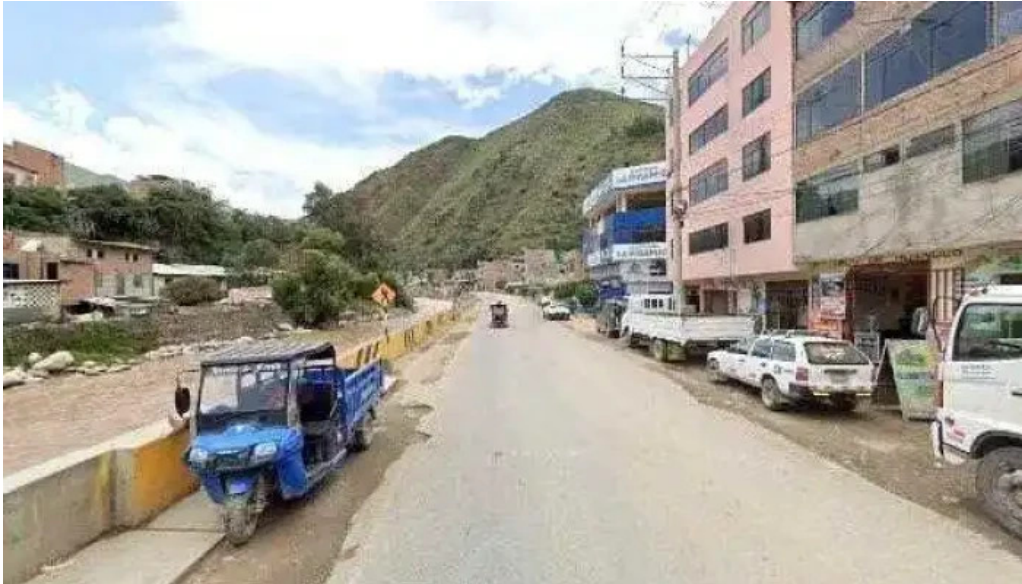
Botica vida sana promocion