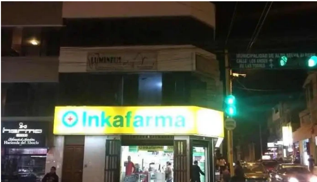
Inkafarma alto selva alegre