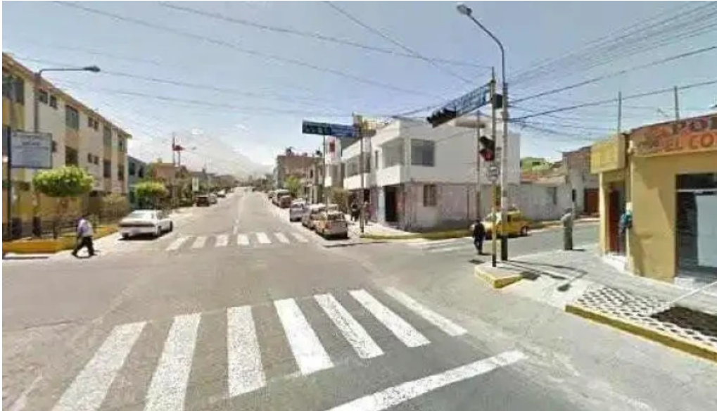
Inkafarma cerca de mi