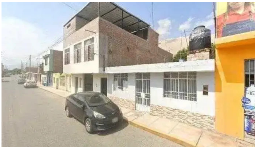
Botica inkasalud numero