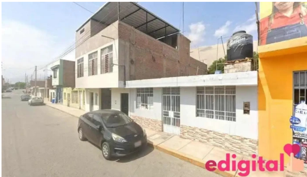
Botica inkasalud acari