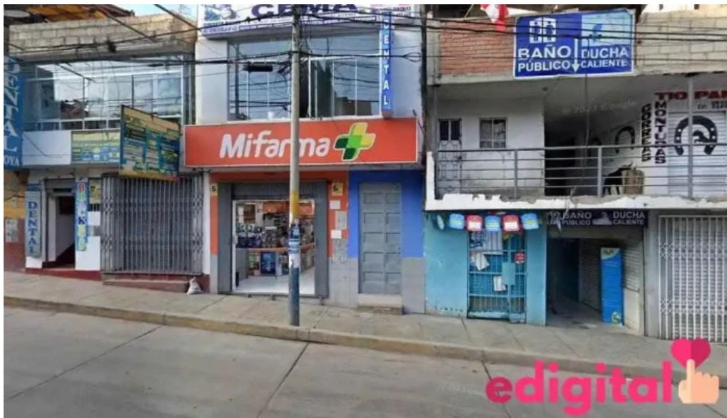
Mi farma abancay