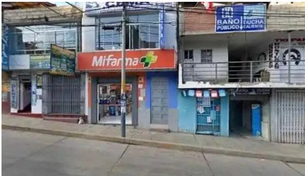
Mi farma abierto ahora