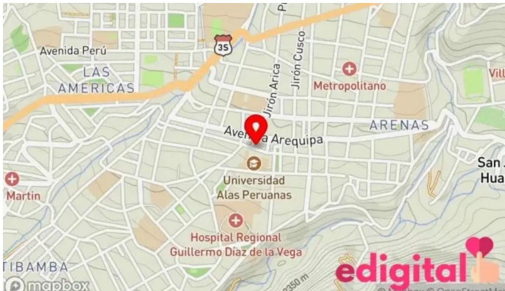
Farmacia farmasur mapa