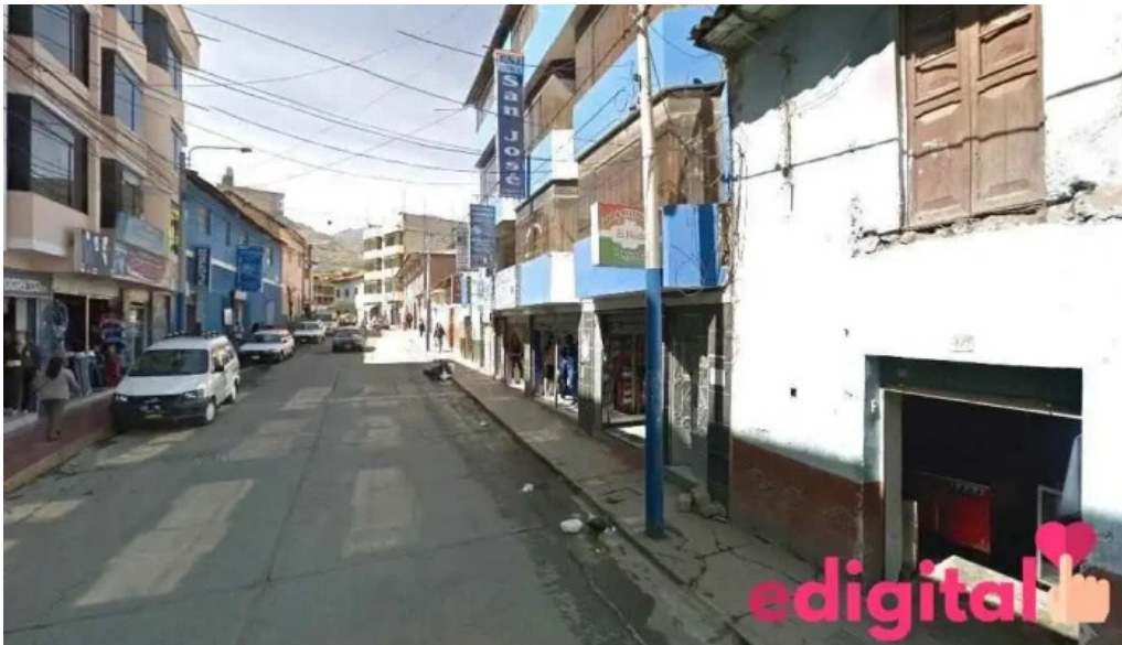
Farmacia farmasur abancay