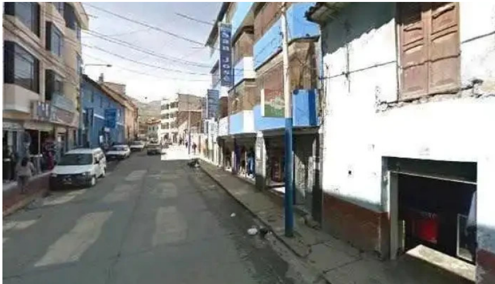
Farmacia farmasur comentarios