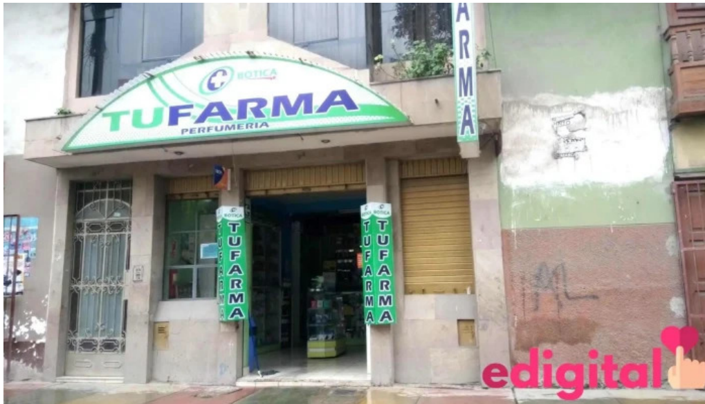
Botica tufarma abancay