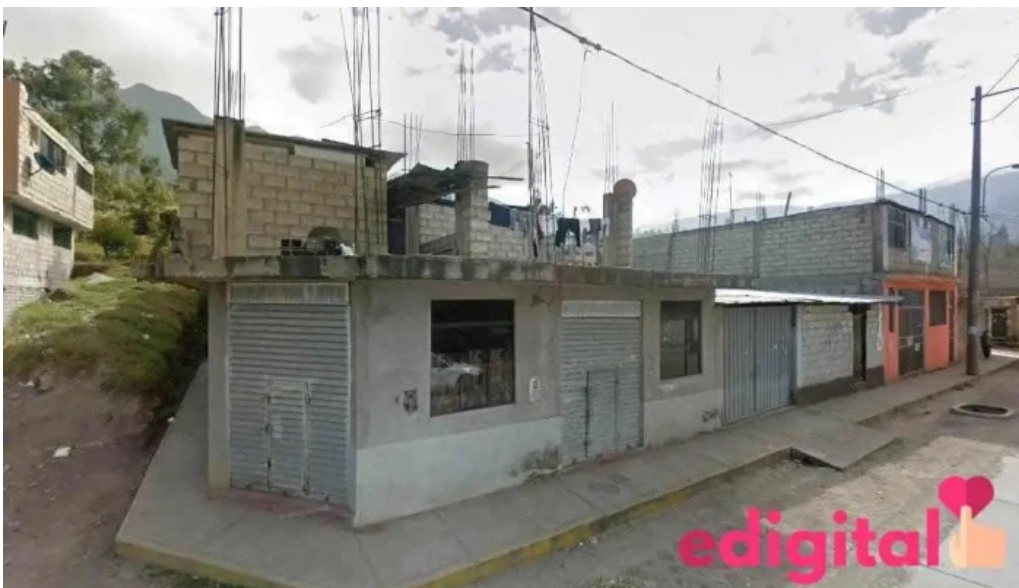
Botica farmavida abancay