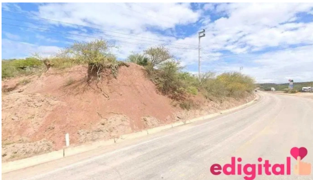
Botica mi camila 5nc