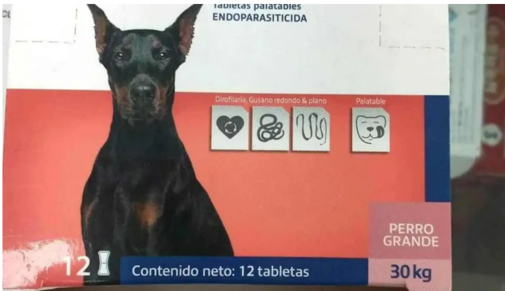
Convét bellavista perro