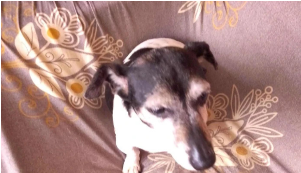
Convét bellavista ubicacion