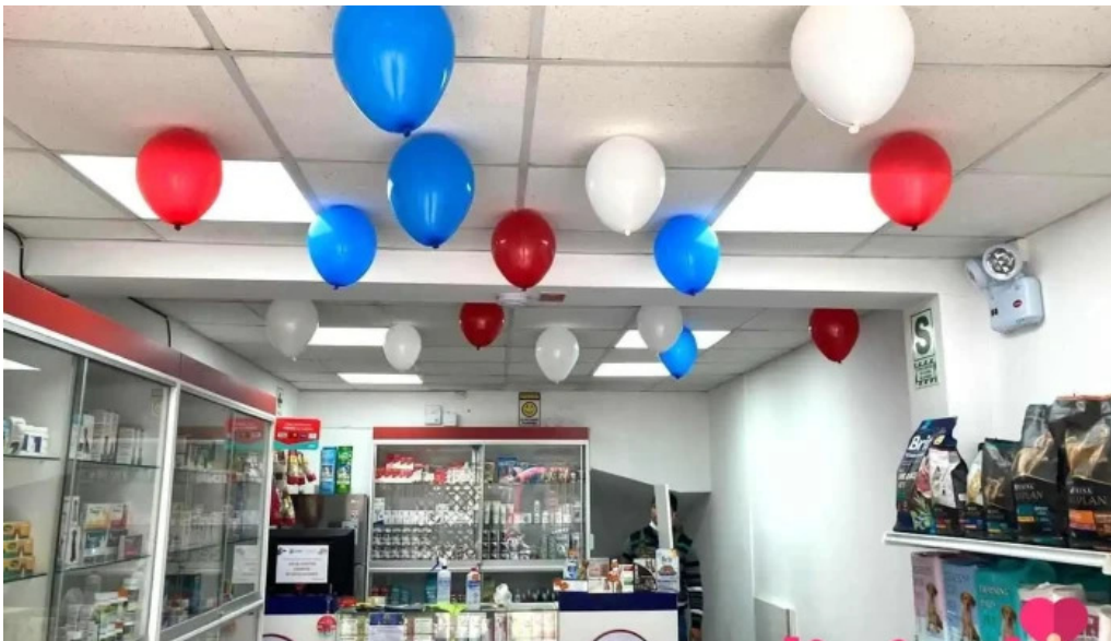
Convét bellavista bellavista