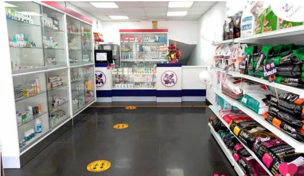
Convét bellavista del propietario