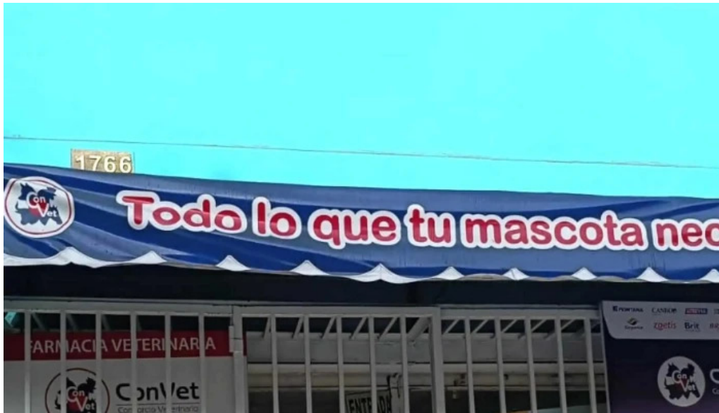
Convét bellavista bellavista