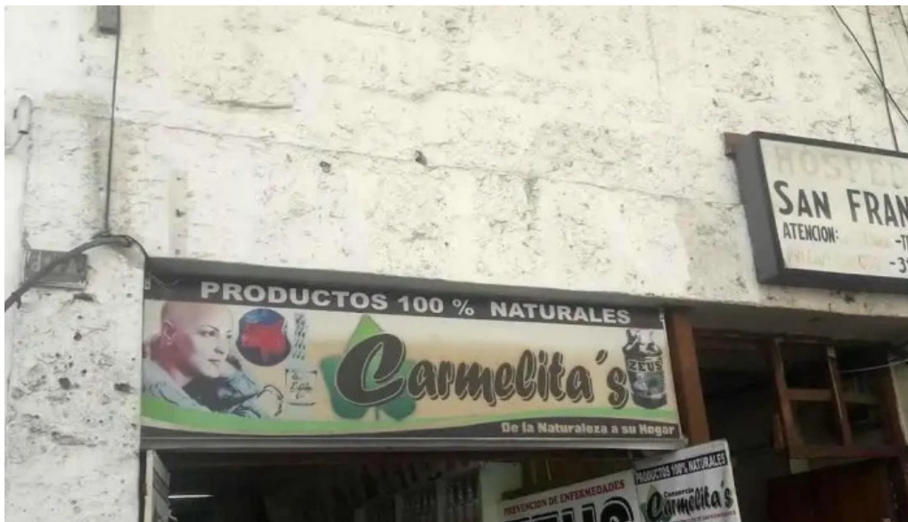
Carmelita s mercado de arequipa