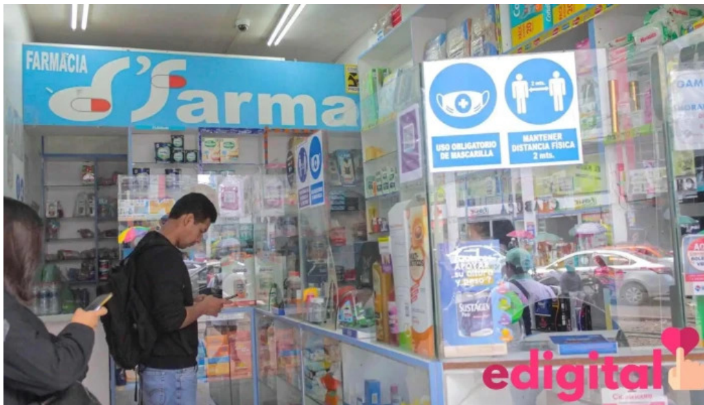
Drogueria dfarma del propietario