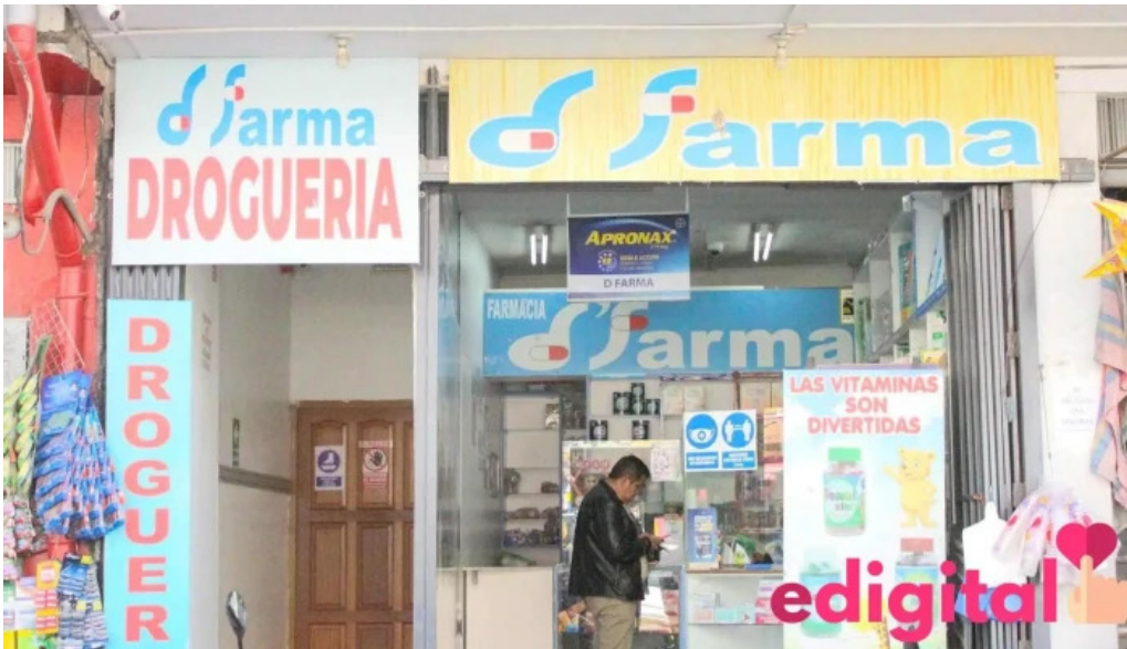
Droguería dfarma abierto ahora