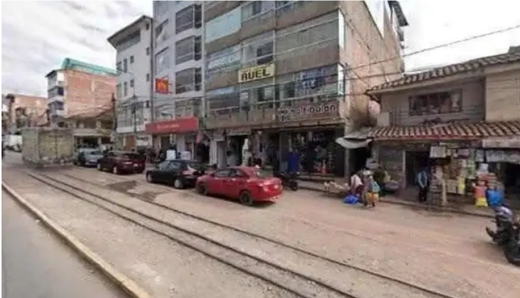
Droguería dfarma abierto ahoradeg