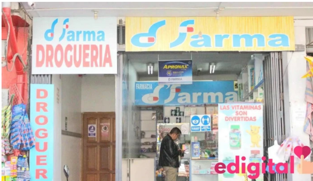
Drogueria dfarma cusco