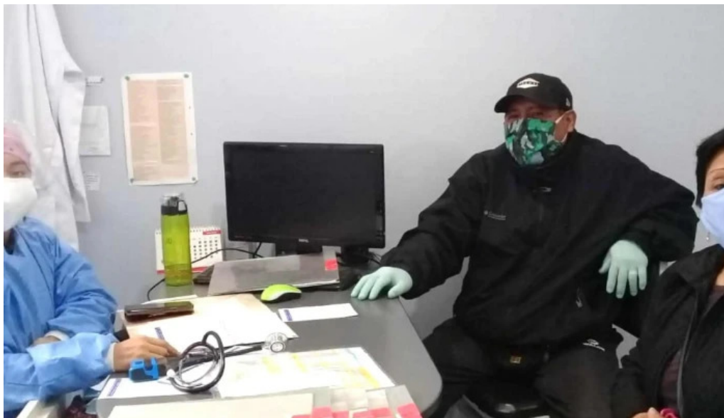
Clinica san andres huaral huaral