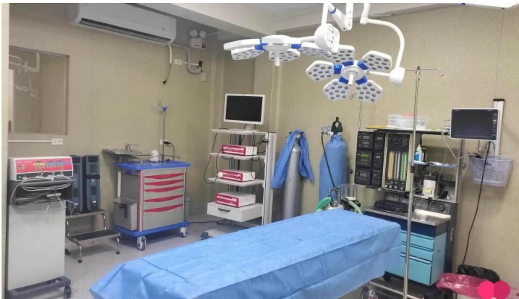
Clinica san andres huaral precios