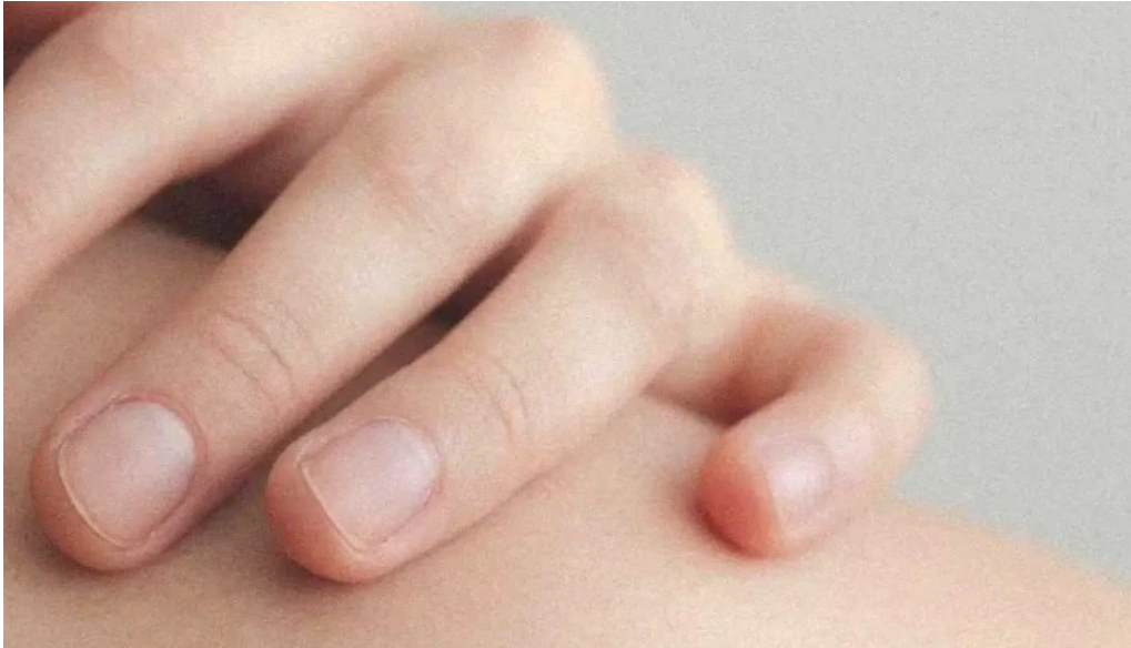
Clinica san andres huaral del propietario